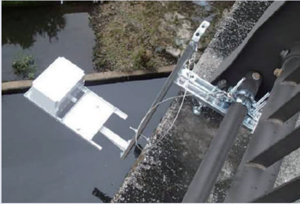
現場実証実験第一弾(鶴見川水系 鳥山川)