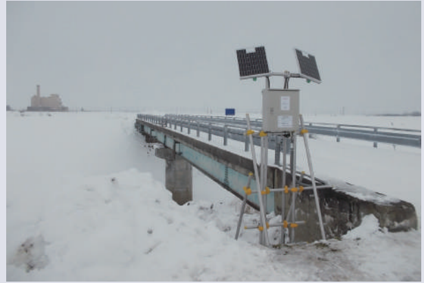
現場実証実験第二弾※寒冷地仕様(最上川水系)