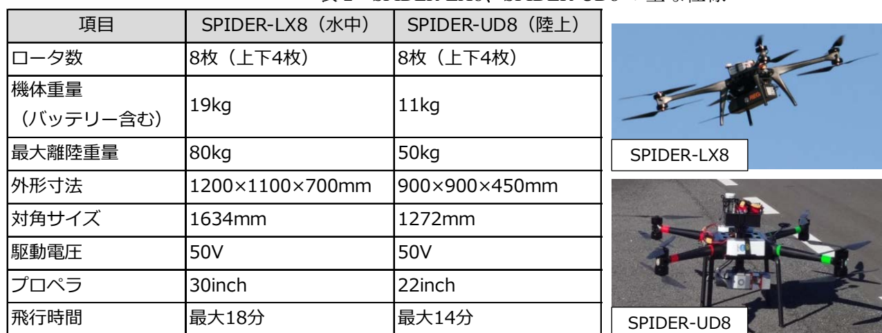
表 2 SPIDER-LX8、SPIDER-UD8 の主な仕様