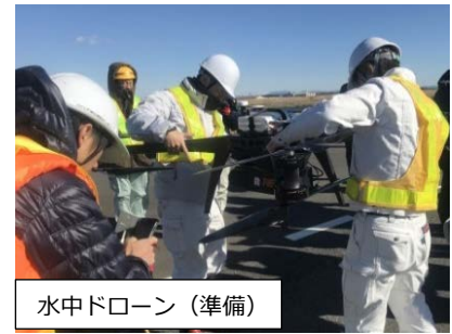
水中ドローン（準備）