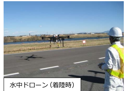
水中ドローン（着陸時）