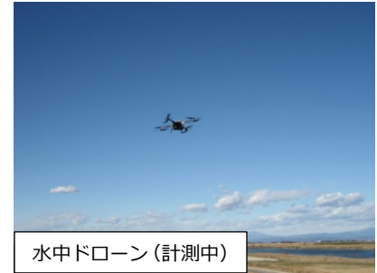
水中ドローン（計測中）